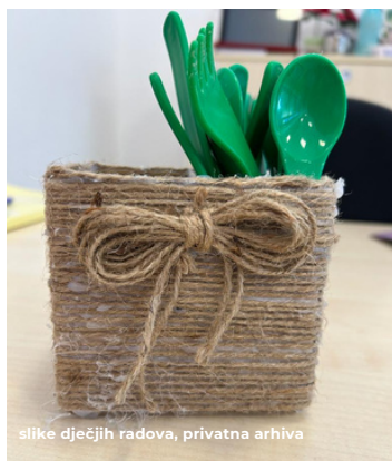
slike dječjih radova