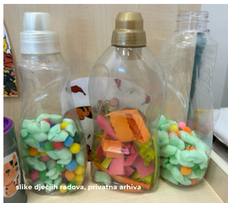
slike dječjih radova